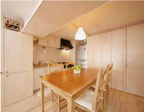
キッチン前面の壁は外国製タイルを使用。「なるべく物を見せたくない」という要望で、壁一面に収納スペースを設け、食器や生活用品を収納。電子レンジなど電化製品も入れたまま使える