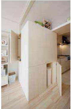
ゴミ箱も収納できる、2面開きのオリジナル収納。引出し式の作業机も組み込まれている