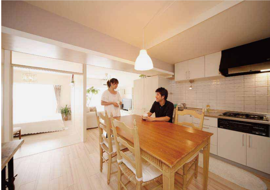
「まるで違う家に来たみたい。とにかく明るいです」とTさん。天井は最大限高くし、構造上残るDKの梁には細工を施し、逆にアクセントに「お気に入りのアンティークテーブルを中心に、生活感を出さずすっきり広く、という希望どおり。家に帰って来るのが楽しみになりました」