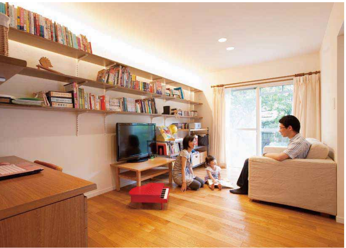
「子どもと本を読んだり、絵を描いたり。本棚がたくさんあるブックカフェ」をイメージした1階。壁いっぱいには設けた本棚は可動式で、高さを変えることも容易。本棚上の間接照明が室内を柔らかく照らす。1階は、無垢のフローリングに二重窓、壁は「エコカラット」を使用（LD）