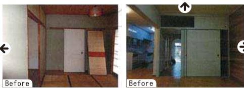
間仕切りを無くして、広々とした明るい部屋に。「北欧風」にインテリアやカーテンをオーダー