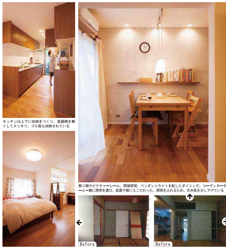
キッチン上下に収納をつくり、食器棚を無くしてスッキリ。ゴミ箱も収納されている