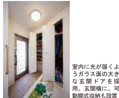
室内に光が届くよう大きなガラス面を採用。玄関横に、可動棚式収納も設置