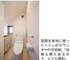
空間を有効に使ったトイレのカウンター付き収納。「収納も棚もあるので、とても便利」