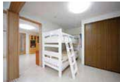
洋室2室に変更。子供が大きくなった時にそれぞれの個室にできるよう間仕切りは引き戸