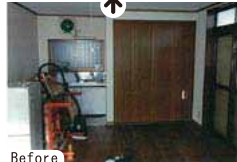
Before ガレージ横は、キッチンと収納のある休憩室。収納スペースはそのまま生かしてリフォーム