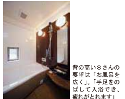
背の高いSさんの要望は「お風呂を広く」「手足をのばして入浴でき、疲れがとれます」