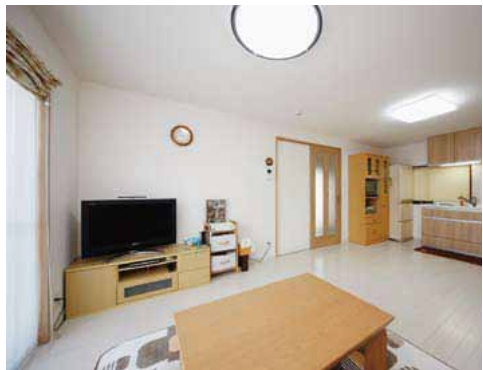
LDKはすべて元ガレージだった部分。「明るい部屋に」と、夫人の希望でフローリングは白で統一。シャッターを大きめの掃き出し窓にしたので、陽光もたっぷり注ぐ。窓は断熱サッシ