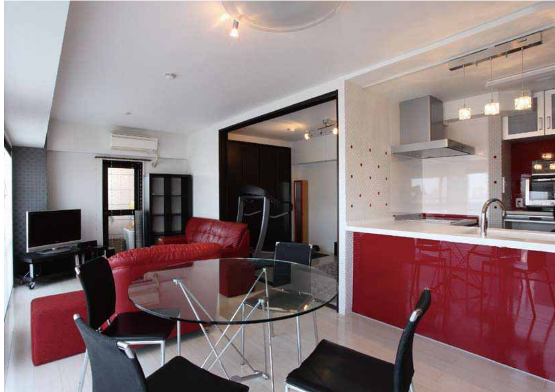
キッチンを対面スタイルにしたことでLDとの一体感が増した、開放感いっぱいの室内。赤のキッチンは夫人のお気に入り。「壁のタイルも、サンプルを取り寄せて自分たちで選びました」。レンジフード横のタイル壁は、角をとったデザイン。きめ細かな設計・施工にも注目