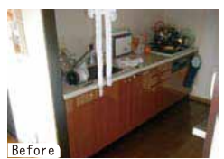
以前のキッチンは独立型。「ホームパーティーの時などは、ちょっとさびしかった」（夫人）

「リ」の会社 「エ」の会社 「ン」の会社 「シ」の会社 「ョ」の会社 「ウ」の会社 「ン」の会社 「リ」の会社 「ン」の会社 「シ」の会社 「ョ」の会社 「ウ」の会社 「ン」の会社