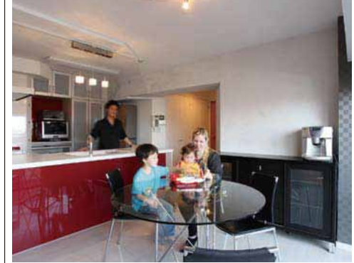
「キッチンにいても子供の様子がわかるのがいいですね。LDへの動線を考え、入口の壁はアール形にし、角も丸く。キッチン天井もアールのデザインに。壁にはラメをコーティング