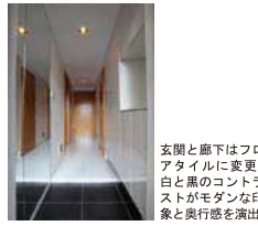
玄関と廊下はフロアタイルに変更。白と黒のコントラストがモダンな印象と奥行きを演出