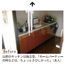
以前のキッチンは独立型。「ホームパーティーの時などは、ちょっとさびしかった」（夫人）