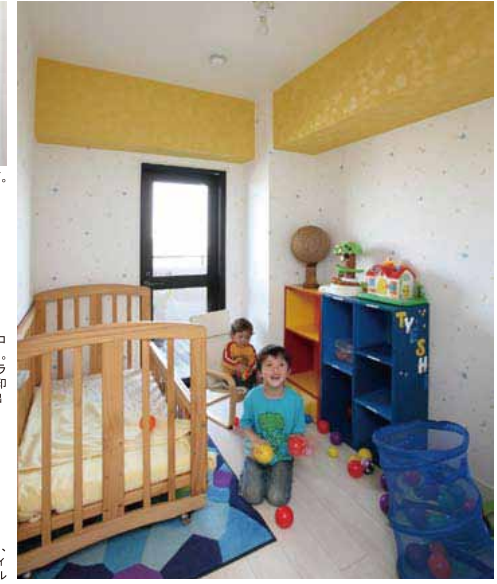
家族の気配が伝わるLDの一角に子供室を新設。淡い色に黄色のクロスをアクセントに用い、可愛らしく夢のある空間が出来上がった。夫人のアイデアで、壁にビー玉も埋め込んである