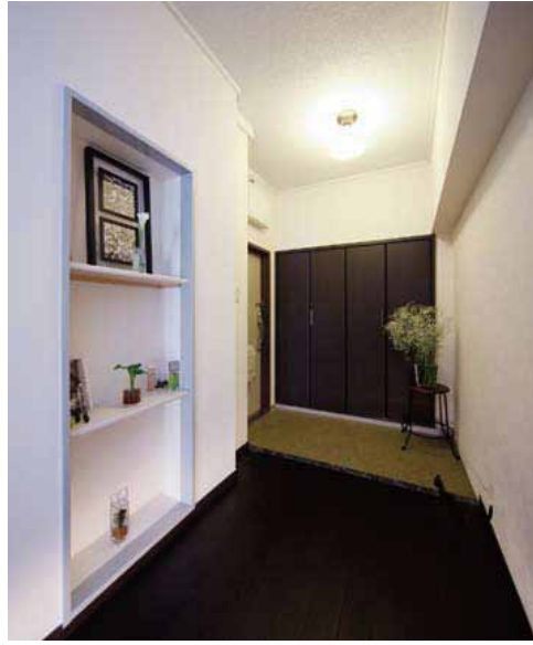
「良いものは残そう」と、ゆとりを感じさせる玄関や廊下の広さはそのまま生かすことに。新たにゴルフバッグ2つとたくさん靴が入る収納を設置。櫃には黒い床に合わせた素材をセレクト