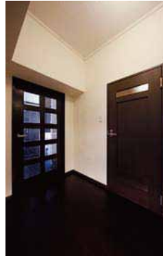
左側のLDの扉は、デザインが良かった既存ドアを黒く塗装。右側は新しくした洗面室の扉