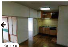
バルコニー側に洋室と和室があり、LDが暗い。キッチンは古く、この位置では幅も狭かった