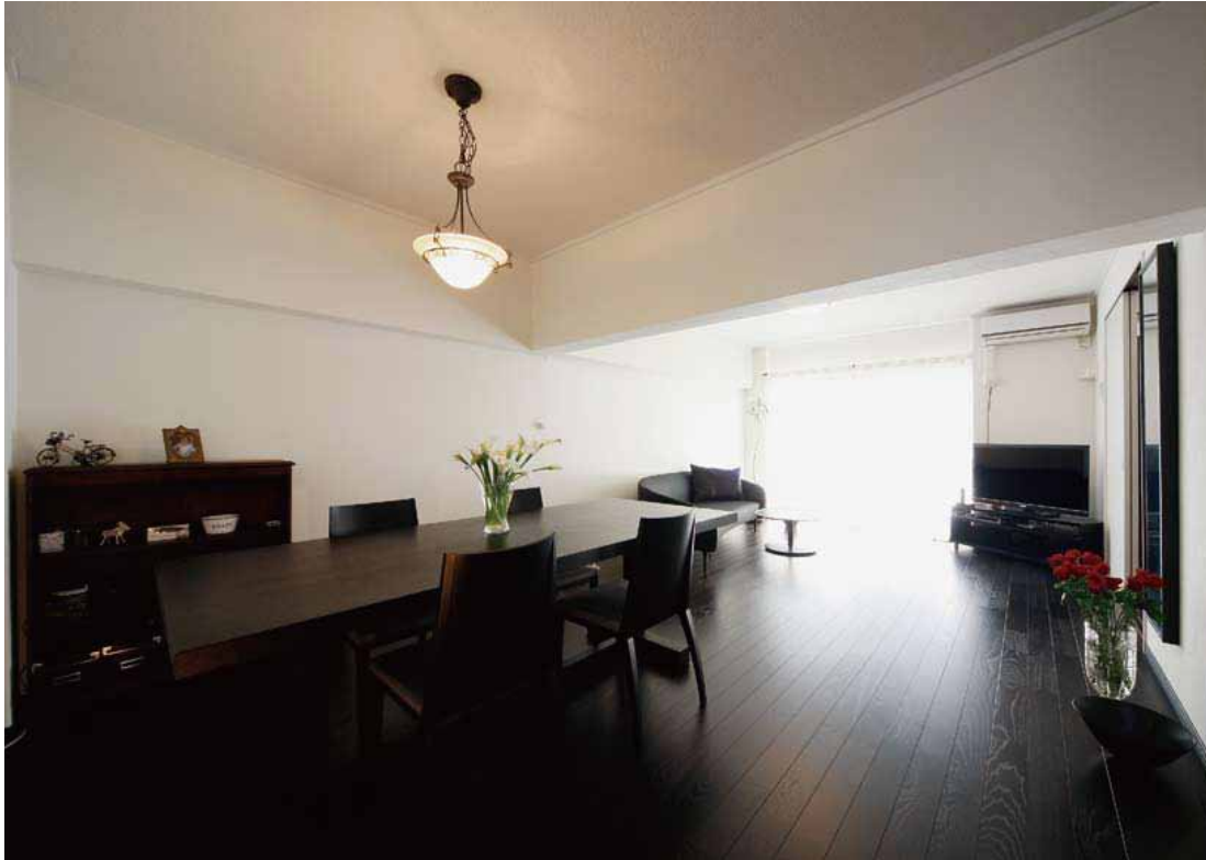
3LDKを2LDKに変更、フローリングや建具、家具もすべて黒でまとめたシックな室内。アンティーク風の照明も、中尾さんが持ってきたカタログが決めた。○夫人が気に入ったフローリングは防音タイプではなかったため、床を置き床式に変更して使用。床下には新設した配管が通る