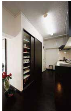
キッチンは位置を変えてワイドに。家電品や食器がすて入る可動棚の引き戸収納も設置