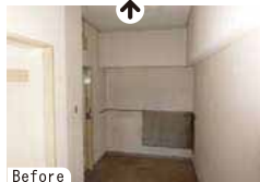
玄関と廊下が広がったので、当初は廊下を狭くして、居室スペースを広げることも検討