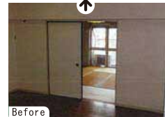
築41年。フルも併設されたヴィンテージマンションだが、時を経た相応の古さがあった